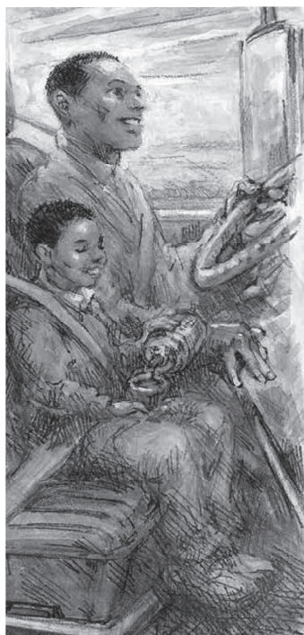
© Illustration by D. Brent Burkett