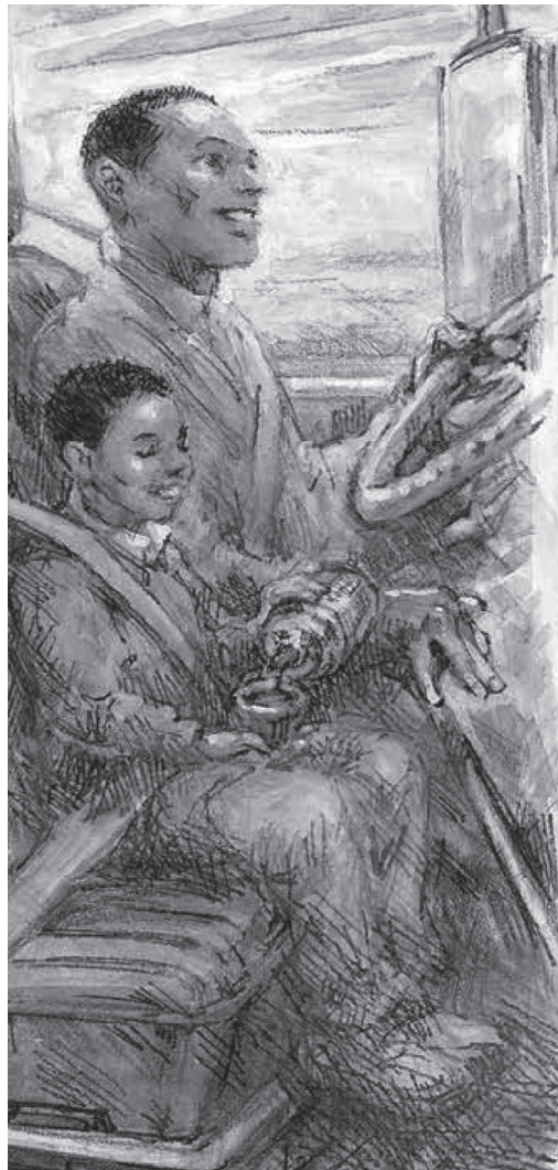
© Illustration by D. Brent Burkett