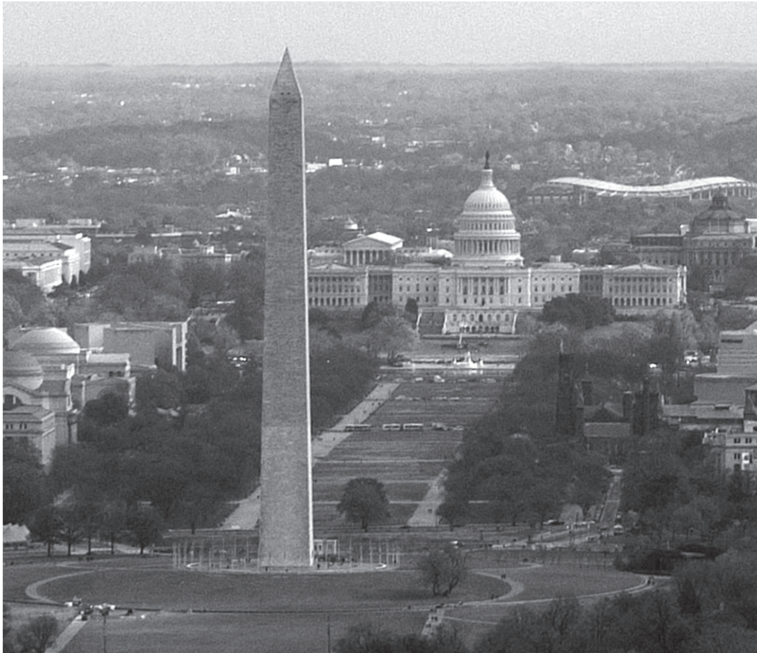
Una vista panorámica del National Mall.